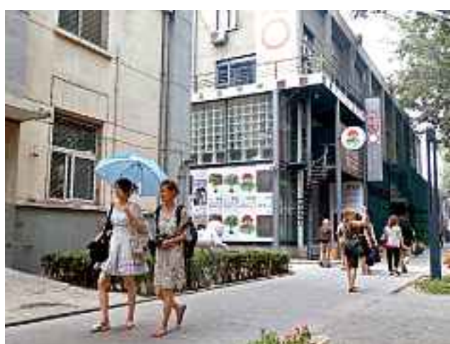
► Los edificios construidos para albergar talleres y maquinaria hoy son perfectos para exhibir arte contemporáneo.