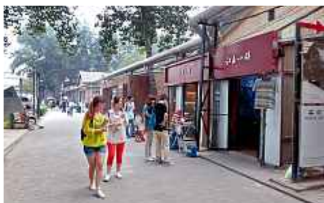
► El turismo se ha desbordado en la zona; las galerías conviven ahora con bares y tiendas de diseño.

► Esta zona industrial estuvo abandonada; los artistas la renovaron y hoy es punto obligado