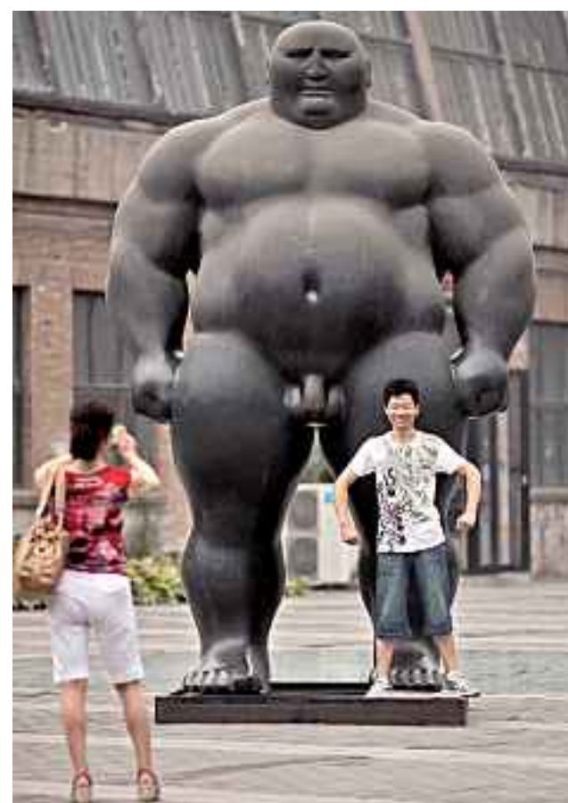
► La escultura “Mongolian Standing”, del artista chino Shen Hong Biao, favorita para la foto del recuerdo.

► El pasillo que lleva a estos viejos galpones se ha convertido en importante escaparate para obras de gran formato. Aquí, los lobos de Liu Ruowang: se volvieron tan célebres que fueron comprados por un millonario neozelandés.